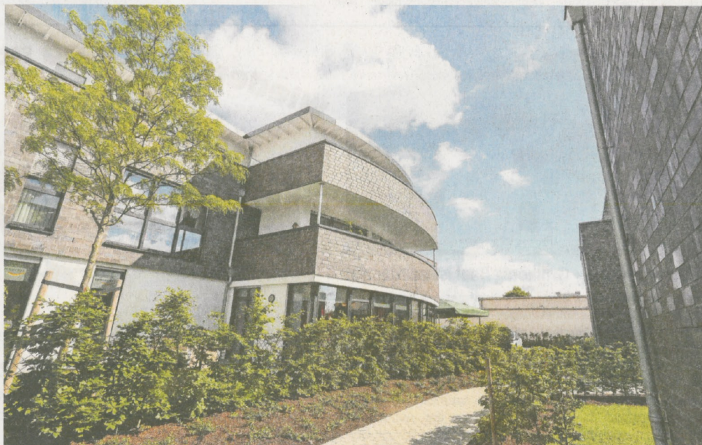
Neben dem Gewerbe in der Neuen Mitte entstanden auch 40 Wohnungen, die modernsten Standards entsprechen.

PLANUNG / BAULEITUNG / PROJEKTENTWICKLUNG